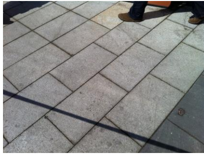
Beispiel einer optimalen Verarbeitung mit qualitativ hochwertigen Fugen welche eine lange Lebensdauer aufweisen