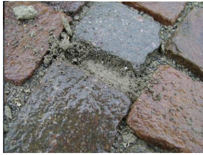
Beispiel einer schlechten Fugenfüllung mit zuviel Wasser und einer ungeeigneten Reinigung.